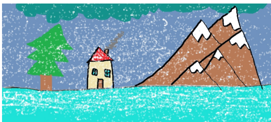
Emilia Arent-Irzyk, klasa 1b