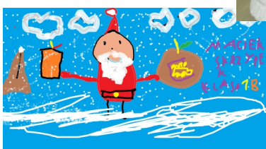
Maciej Skrzypek klasa 1b