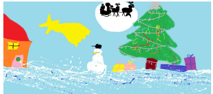
Amelia Rotter, klasa 4b

21.12.2017 - klasowe spotkania opłatkowe