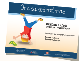
DZIECKO Z ADHD W SZKOLE I PRZEDSZKOLU