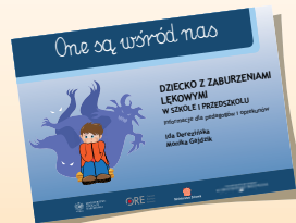
DZIECKO Z ZABURZENIAMI LĘKOWYMI W SZKOLE I PRZEDSZKOLU