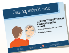
DZIECKO Z ZABURZENIAMI PSYCHOTYCZNYMI W SZKOLE