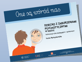
DZIECKO Z ZABURZENIAMI PSYCHOTYCZNYMI W SZKOLE