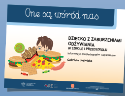
DZIECKO Z ZABURZENIAMI ODŻYWIANIA W SZKOLE I PRZEDSZKOLU