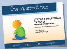
DZIECKO Z ZABURZENIAMI TIKOWYMI W SZKOLE I PRZEDSZKOLU

W drugiej serii „One są wśród nas” ukazały się: