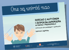
DZIECKO Z AUTYZMEM I ZESPOŁEM ASPERGERA W SZKOLE I PRZEDSZKOLU