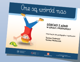
DZIECKO Z ADHD W SZKOLE I PRZEDSZKOLU