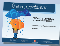
DZIECKO Z DEPRESJĄ W SZKOLE I PRZEDSZKOLU