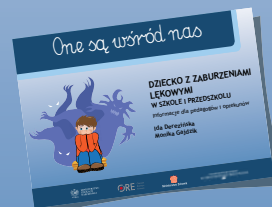
DZIECKO Z ZABURZENIAMI LĘKOWYMI W SZKOLE I PRZEDSZKOLU