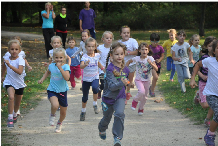
Projekt „Europejskie Święto Sportu”