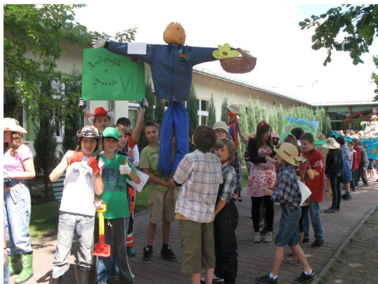
Projekt „Pamiętajcie o ogrodach”