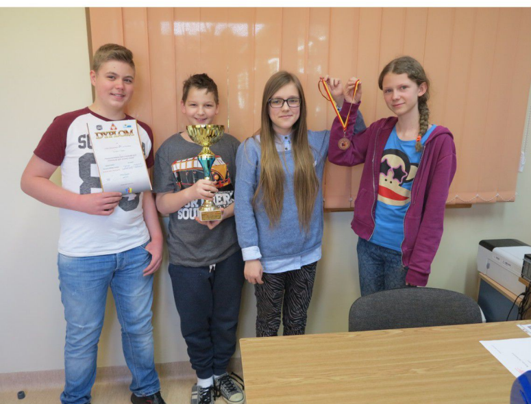
Powiatowy Konkurs „Wrocławski Sport Wczoraj i Dziś”