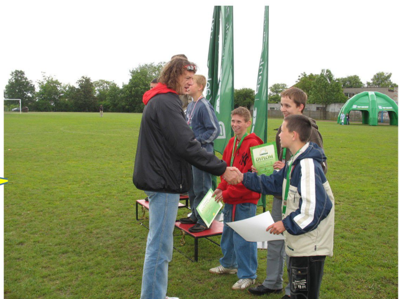
Mistrzostwa w piłce ręcznej