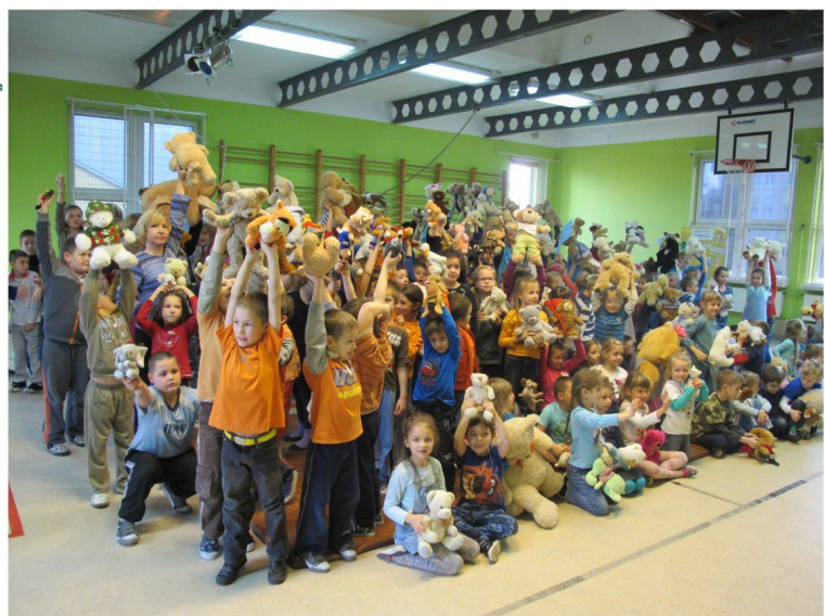
Projekt „Prosto z mostu”