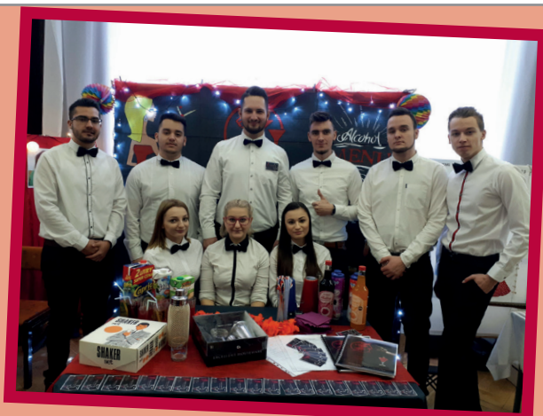
A FLASH CSAPAT

Ezúton fejeznénk ki köszönetünket a Tulajdonos Úr és az Igazgató Úr felé, hogy hozzájárultak e felejthetetlen tanulmányi út megvalósításához!