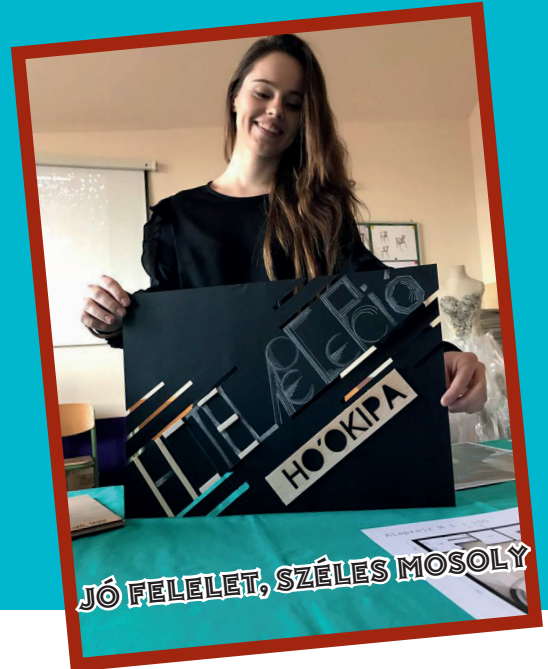
JÓ FELELET, SZÉLES MOSOLY