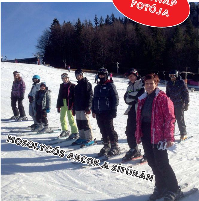
MOSOLYCÓS ARCOK A SÍTÚRÁN