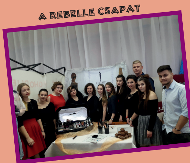
A REBELLE CSAPAT

Az üzletkötés szakon tanuló diákok a 3. évfolyamban, valamint a felépítményi második évfolyamát látogató diákok egy éven át egy céget alapítanak, amivel egy versenyen is megméretik magukat. Február 8-án került megrendezésre a selyyei diákvállalkozók versenye. A felépítményi 2. osztálya egy koktélbárt alapított, aminek a Flash nevet adták. A cégükben különböző szeszes italokat, koktélokot kínáltak. A 3.D-s idegenforgalmista diákok egy divattervező céget álmodtak meg, ahol a gardróbbrendezéssel, divattanácsadással és nem utolsósorban smink tanácsadással is foglalkoztak, ezért a Rebelle nevet adták cégüknek. A megmérettetés